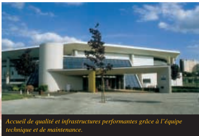
Accueil de qualité et infrastructures performantes grâce à l'équipe technique et de maintenance.

Saluons également le travail des agents techniques du centre qui assurent l'entretien et le nettoyage des deux bâtiments sportifs (complexe et stade couvert) et la maintenance courante des bâtiments, y compris celle de la Maison des comités.