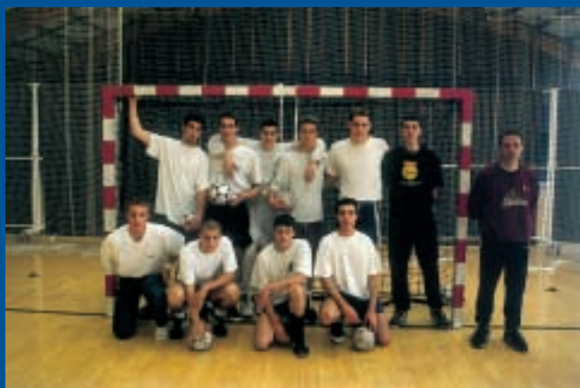
L'équipe de Handball : des espoirs qui gagnent du terrain.

26 filières du sport de haut niveau sont aujourd'hui implantées en Ile-de-France et classées en deux catégories, Pôles France et Pôles espoirs. Le CDFAS joue le jeu !