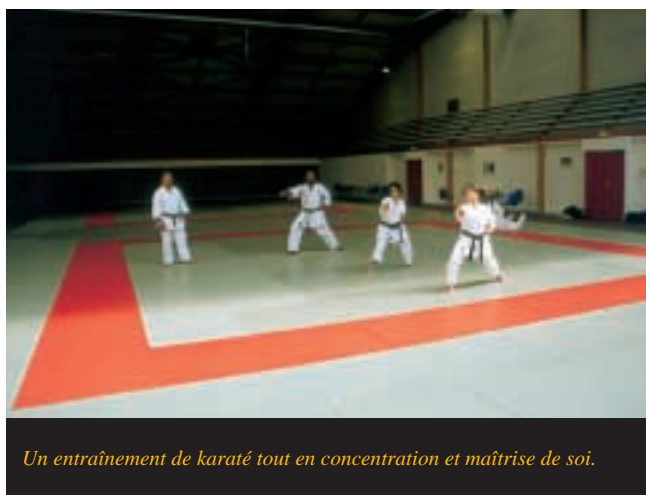
Un entraînement de karaté tout en concentration et maîtrise de soi.

Le Karaté est le premier des arts martiaux et sports de combat à s'installer véritablement au CDFAS.