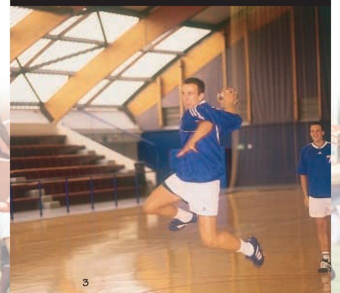
Le pôle handball en pleine extension.

Renseignements CGVO Service des sports Tél. : 01 34 25 30 78.