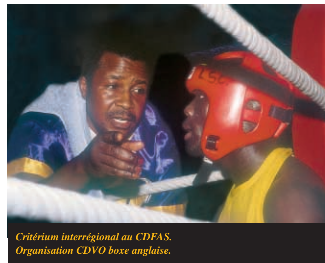
Cratérium interrégional au CDFAS. Organisation CDVO boxe anglaise.

Cette animation sportive, parrainée par Julien LORCY (Champion du monde de boxe - Catégorie léger), se terminera en apothéose lors d'un gala de clôture au CDFAS le samedi 25 mai 2002 réunissant tous les acteurs