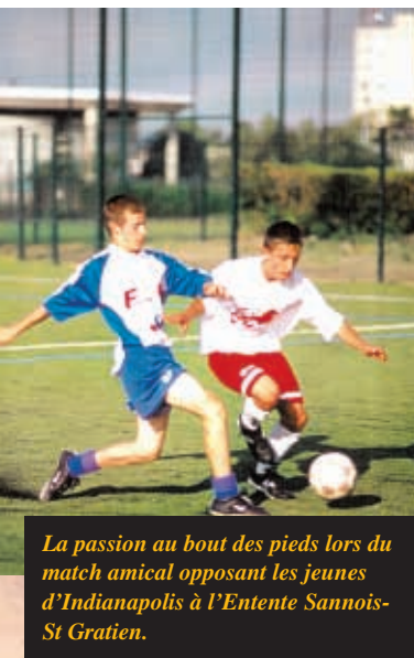
La passion au bout des pieds lors du match amical opposant les jeunes d'Indianapolis à l'Entente Sannois-St Gratien.

Sport Emploi Val d'Oise Tél. : 01 34 27 93 81 Fax : 01 34 27 93 65 http://perso.wanadoo.fr/sevo95