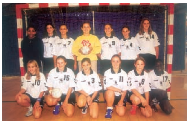
Les jeunes handballeuses du Val d'Oise au CDFAS, futures espoirs, futures championnes.