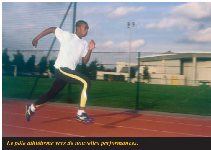
Le pôle athlétisme vers de nouvelles performances.

Le CDFAS accueille aujourd'hui 3 Pôles espoirs régionaux sur son site : handball masculin, basketball féminin, athlétisme. Zoom sur ces activités à travers leur mode d'emploi et fiches signalétiques.