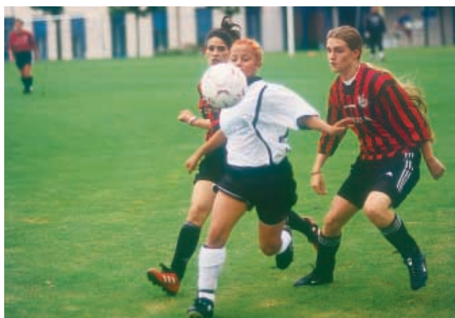
Domont - Bay Oaks de San Francisco : 2-0. Belle performance des françaises face à une équipe des Etats-Unis, l'une des meilleures nations de football féminin.