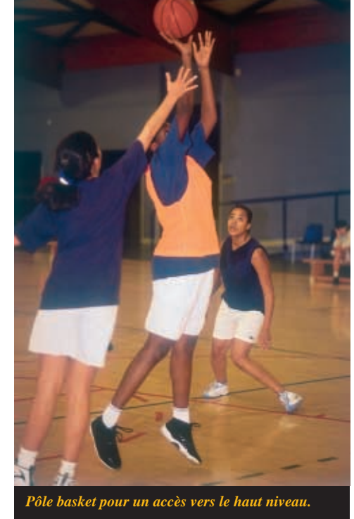
Pôle basket pour un accès vers le haut niveau.

premier lieu, de la Fédération elle-même dans le cadre de sa politique de développement (par exemple : la mise à disposition d'un cadre technique), ensuite de l'Etat, des collectivités territoriales : Conseil général du Val d'Oise et Conseil Régional Ile-de-France (voir encadrés).